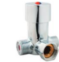
Mixing Valve Vanne De Mélange