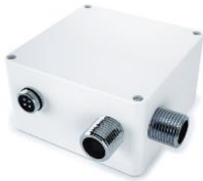
Infrared Control Box Boitier De Contrôle Infraro